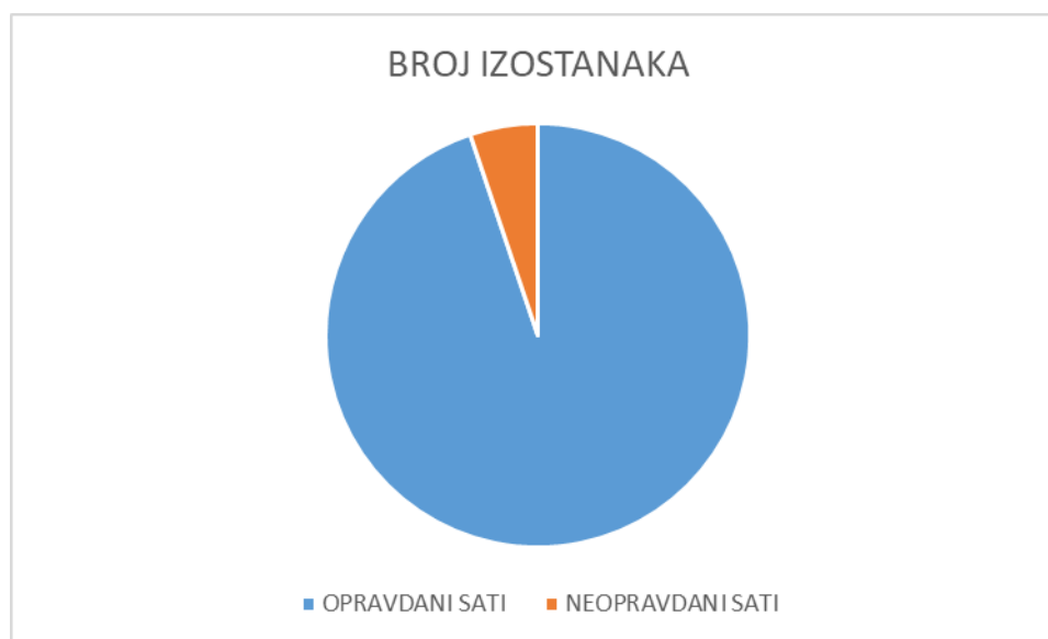
Graf 1. Ukupan broj opravljenih i neopravljenih izostanaka

PEDAGOŠKE MJERE (poticanja i sprečavanja):