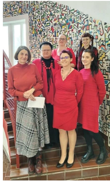
Slika: učiteljice prilikom obilježavanja Dana crvenih haljina