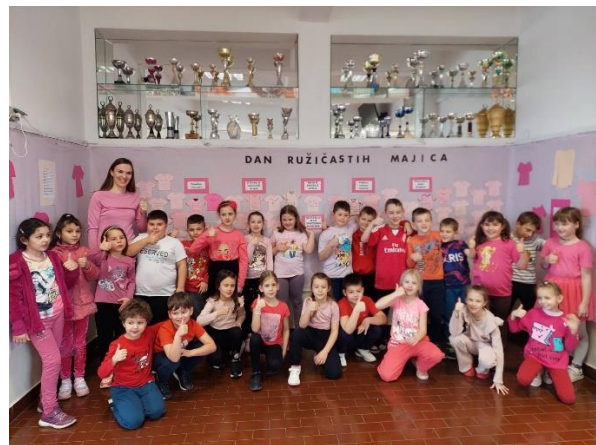
Slike: Učenici i učitelji prilikom obilježavanja Dana ružičastih majica

Dan planeta Zemlje obilježava se 22. travnja kako bi se jačala svijest ljudi prema prirodnom okolišu. Različitim događanjima i akcijama nastoji se skrenuti pozornost ljudi na opasnost koja prijete životu na Zemlji zbog porasta globalnog onečišćenja te ih potaknuti da osvijeste problem zagađenja okoliša. Učenici su obilježili Dan planeta Zemlje prigodnim plakatima i porukama.