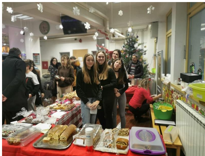
Slika: prostor za okrjepu tijekom Božićnog sajma