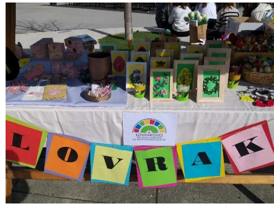
Slike: štandovi na Trgu dr. Franje Tuđmana u Kutini prilikom Uskršnjeg sajma