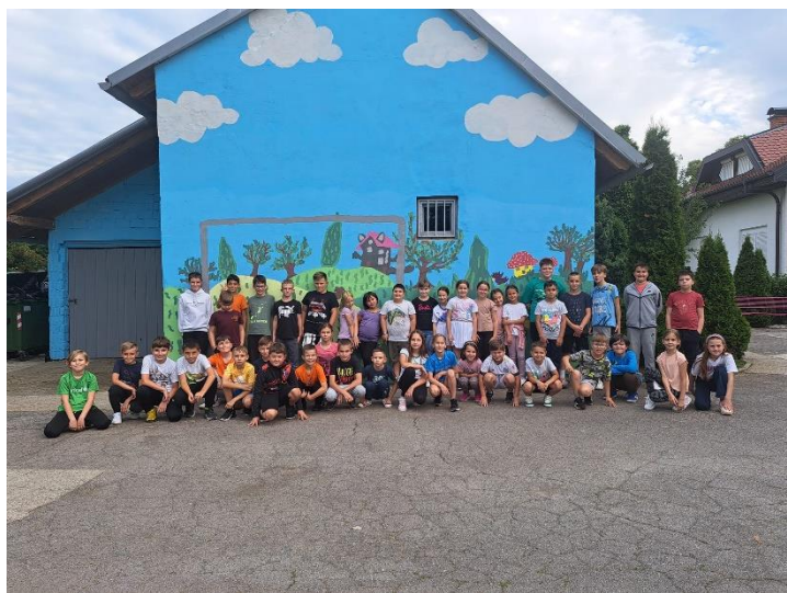
Slika 2. učenici u produženom boravku prilikom obilježavanja Noći knjige