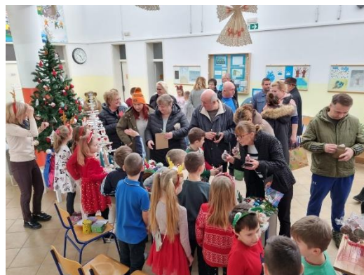
Slike: Božićni sajam u matičnoj školi (lijevo) i u PŠ Kutinska Slatina (desno)