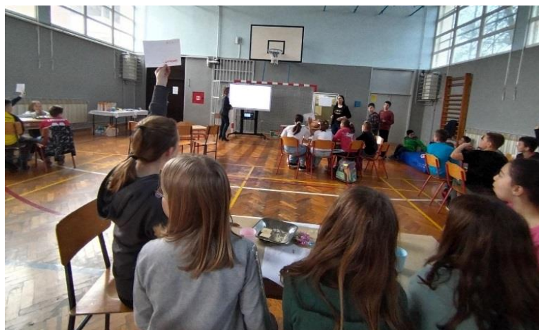
Slika: pub kviz za učenike razredne nastave