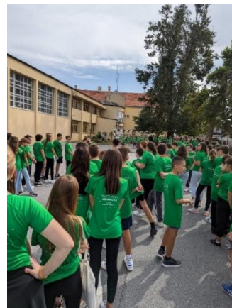
Slika: učenici u dvorištu matične škole prije početka održavanje akcije Mliječna staza