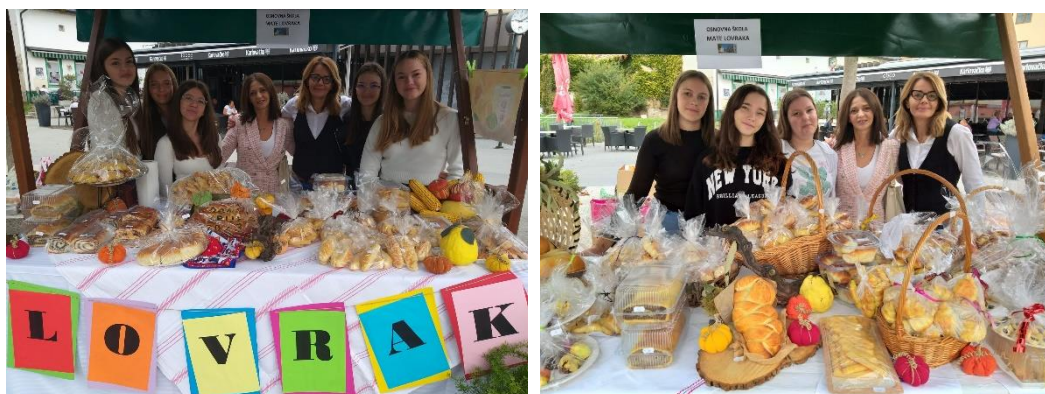
Slike: štandovi na Trgu dr. Franje Tuđmana u Kutini prilikom obilježavanja je Dana kruha i zahvalnosti za plodove zemlje